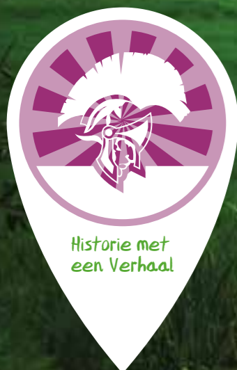
Historie met een Verhaal