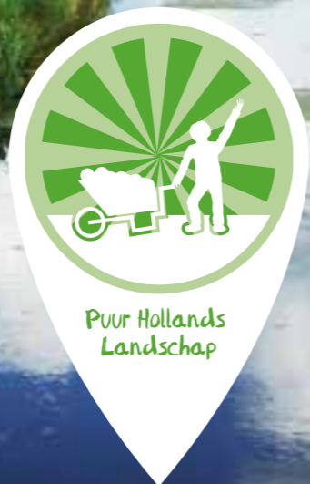
Puur Hollands Landschap