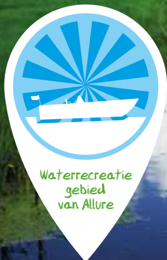
Waterrecreatie gebied van Allure